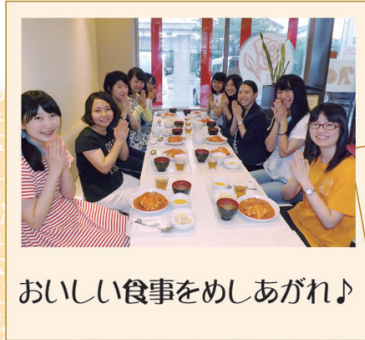
おいしい食事をめしあがれ♪

おしゃれなロザリアンカフェ「ミロ」。 お友達と、ちょっとステキな時間を過ごしてみよう?