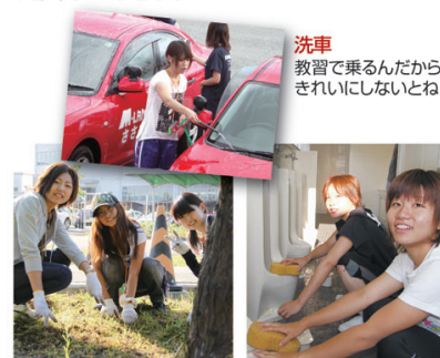
洗車 教習で乗るんだから きれいにしないとね!

Mランドで使えるMランドが発行する「Mマネーポイント」 所内で清掃などのボランティアを行ったり、ありがとうカードを書いたり「優しい心」「温かい心」を示すと、Mマネーはどんどんゲットできちゃうのです。 Mマネーの「M」は、メンタル(こころ)のMでもあるのです。 ちなみに、ゲットしたマネーだけで過ごした人もいます。