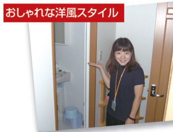
おしゃれな洋風スタイル