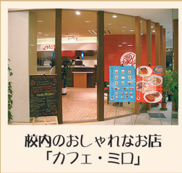
校内のおしゃれなお店 「カフェ・ミロ」