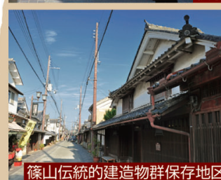
篠山伝統的建造物群保存地区