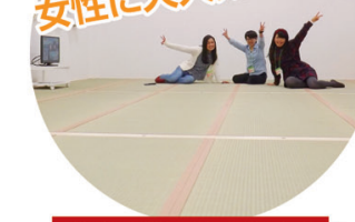
仲間と楽しく過ごせます